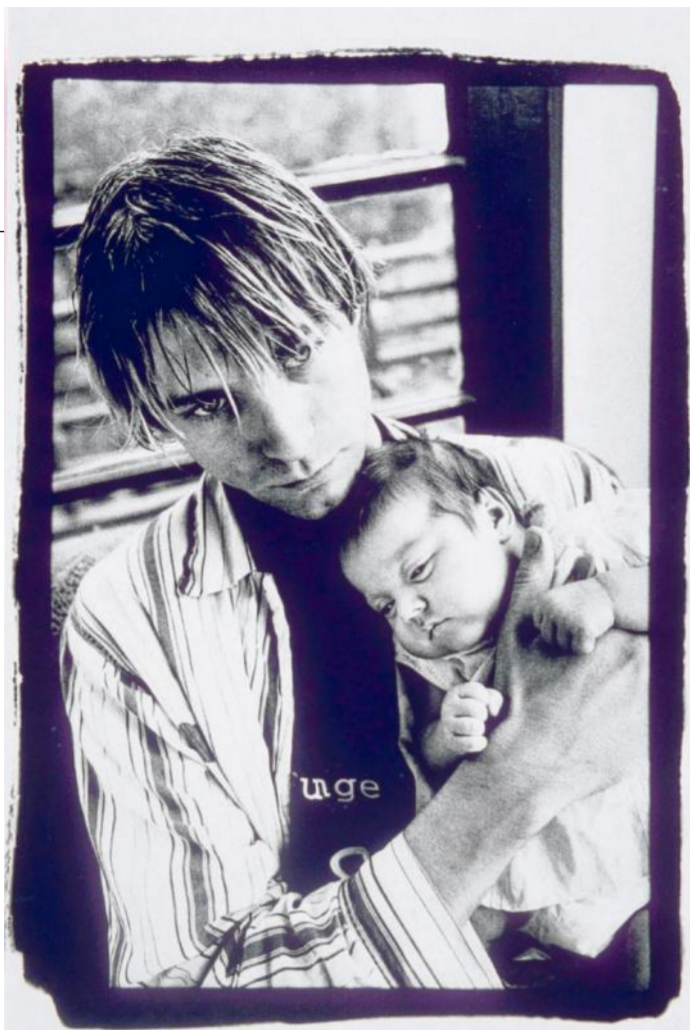
Kurt Cobain en dochter Frances Bean