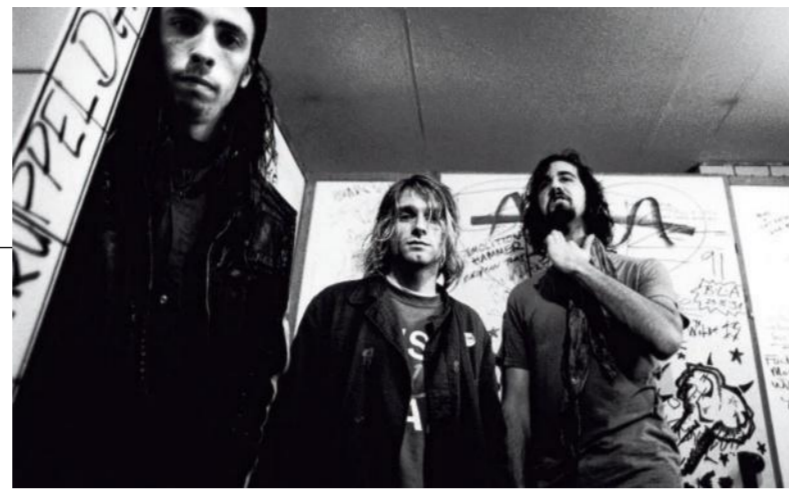
Nirvana in 1991. Krist Novoselic, Kurt Cobain, Dave Grohl.

miljoen albums, en zijn ze een van de best-verkopende acts wereldwijd - nog steeds. Hun shirts zijn mode, te koop in kindermaatjes, als sportkleding en pyjama's. Bezoeken en basisschoolkinderen lopen er nog altijd in en, nou ja, ik ook.